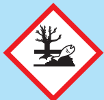
Schadelijk voor het milieu